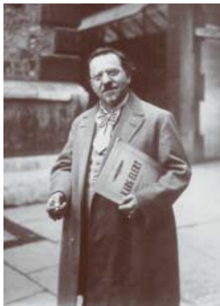
Sigfrid Karg-Elert voor de kerk van St. Lawrence Jewry, Londen, tijdens het aan hem gewijde festival in 1930.