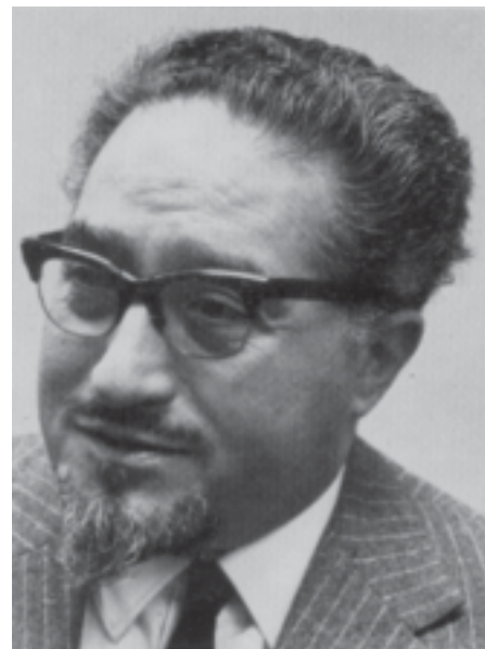
Portretfoto uit de jaren zestig.